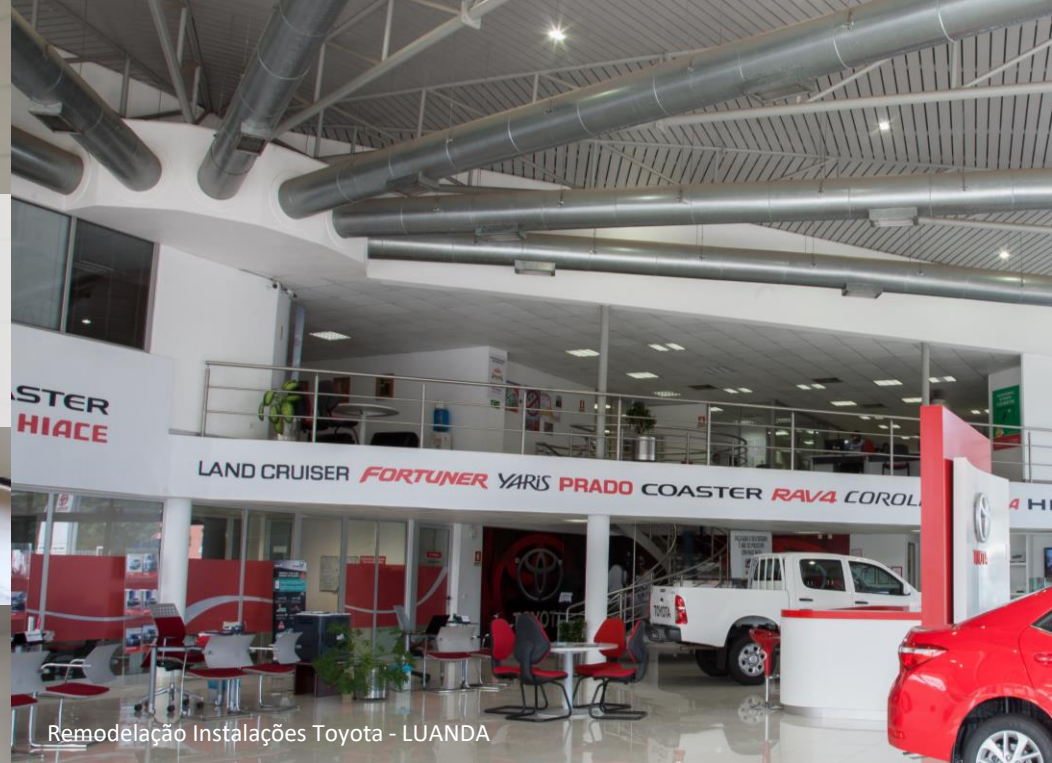
Remodelação Instalações Toyota - LUANDA