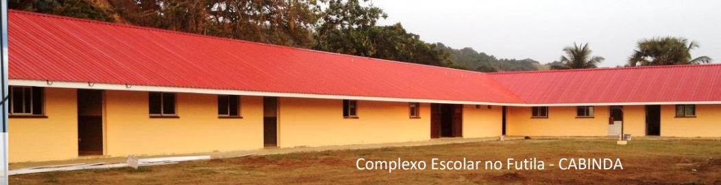
Complexo Escolar no Futila - CABINDA