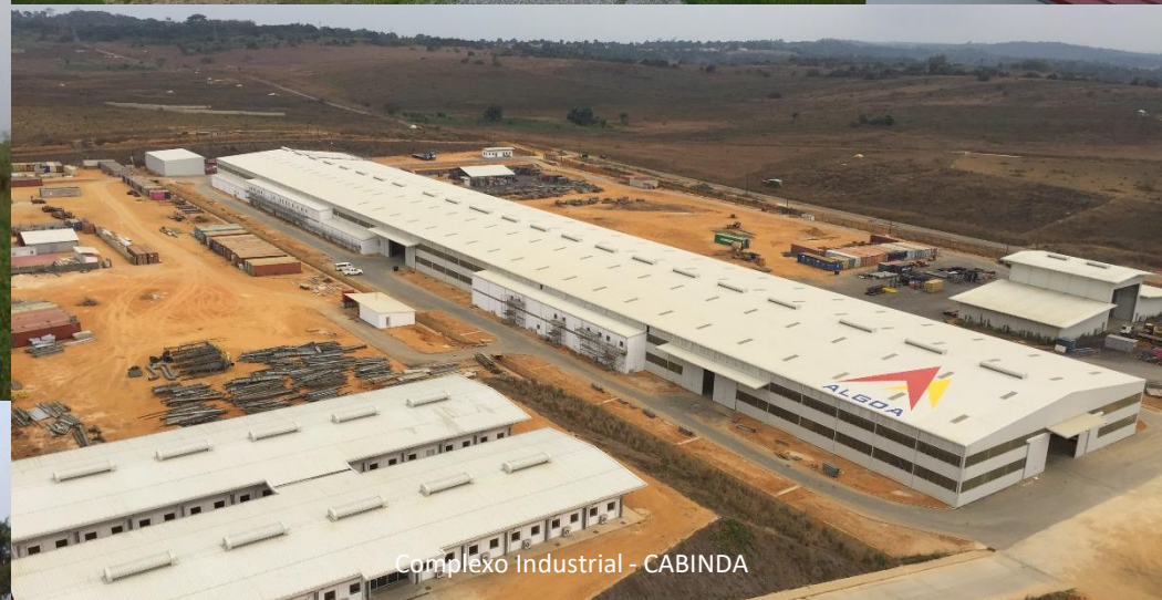
Complexo Industrial - CABINDA