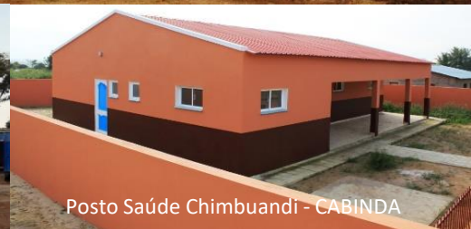
Posto Saúde Chimbuandi - CABINDA