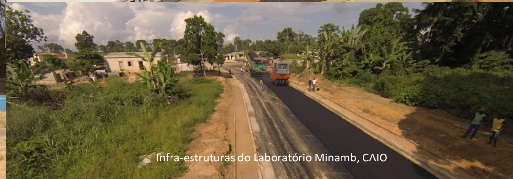
Infra-estruturas do Laboratório Minamb, CAIO