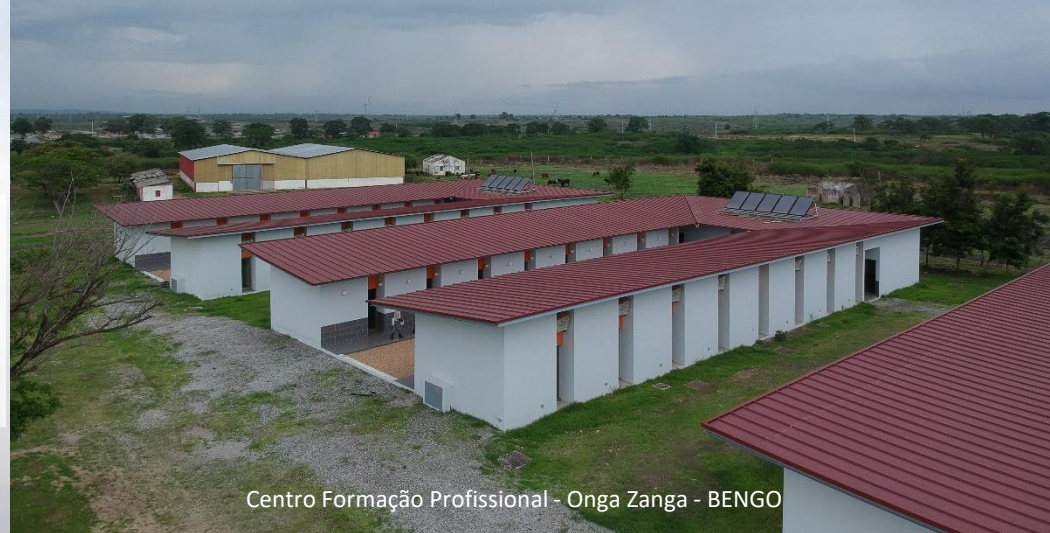
Centro Formação Profissional - Onga Zanga - BENGU