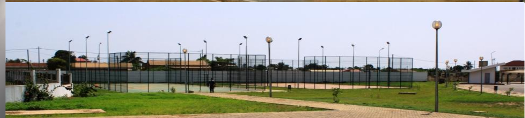
Parque Recreativo no Malongo - CABINDA