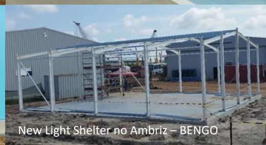
New Light Shelter no Ambriz - BENGU