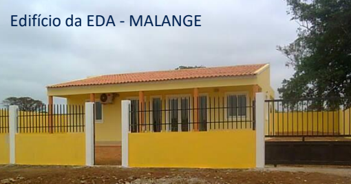
Edifício da EDA - MALANGE