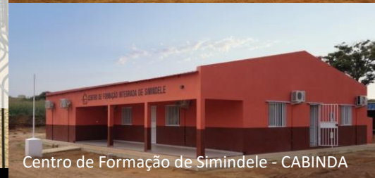
Centro de Formação de Simindele - CABINDA