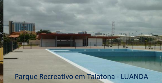
Parque Recreativo em Talatona - LUANDA