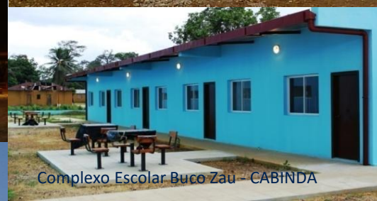
Complexo Escolar Buco Zau - CABINDA